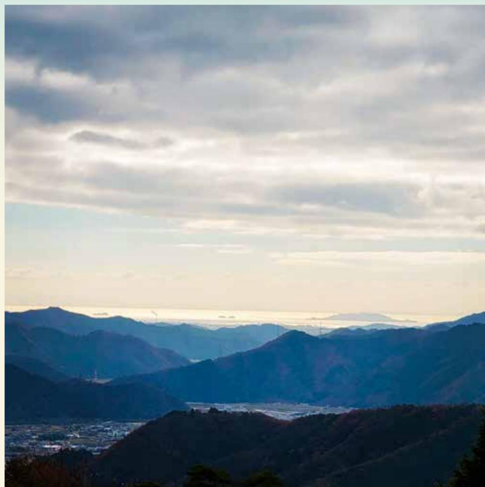
長水山の山頂から瀬戸内海を望む