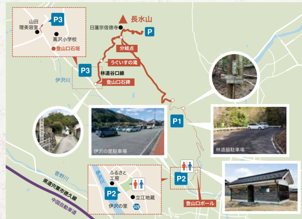
※伊沢の里からP1まで車で行くこともできます。※林道なのでお気をつけください。 ※P3へは蔦沢小学校の校門のすぐ北から進入できます。