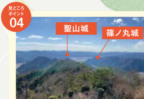
二ノ郭からの眺望

五十波方面からの登山道を信徳寺の直下までたどり着くと水場があり、現在も水を湛えています。