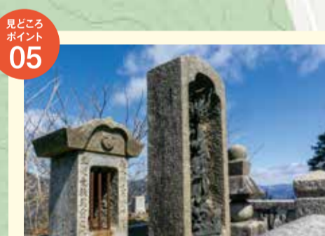
城主 宇野氏の追悼碑